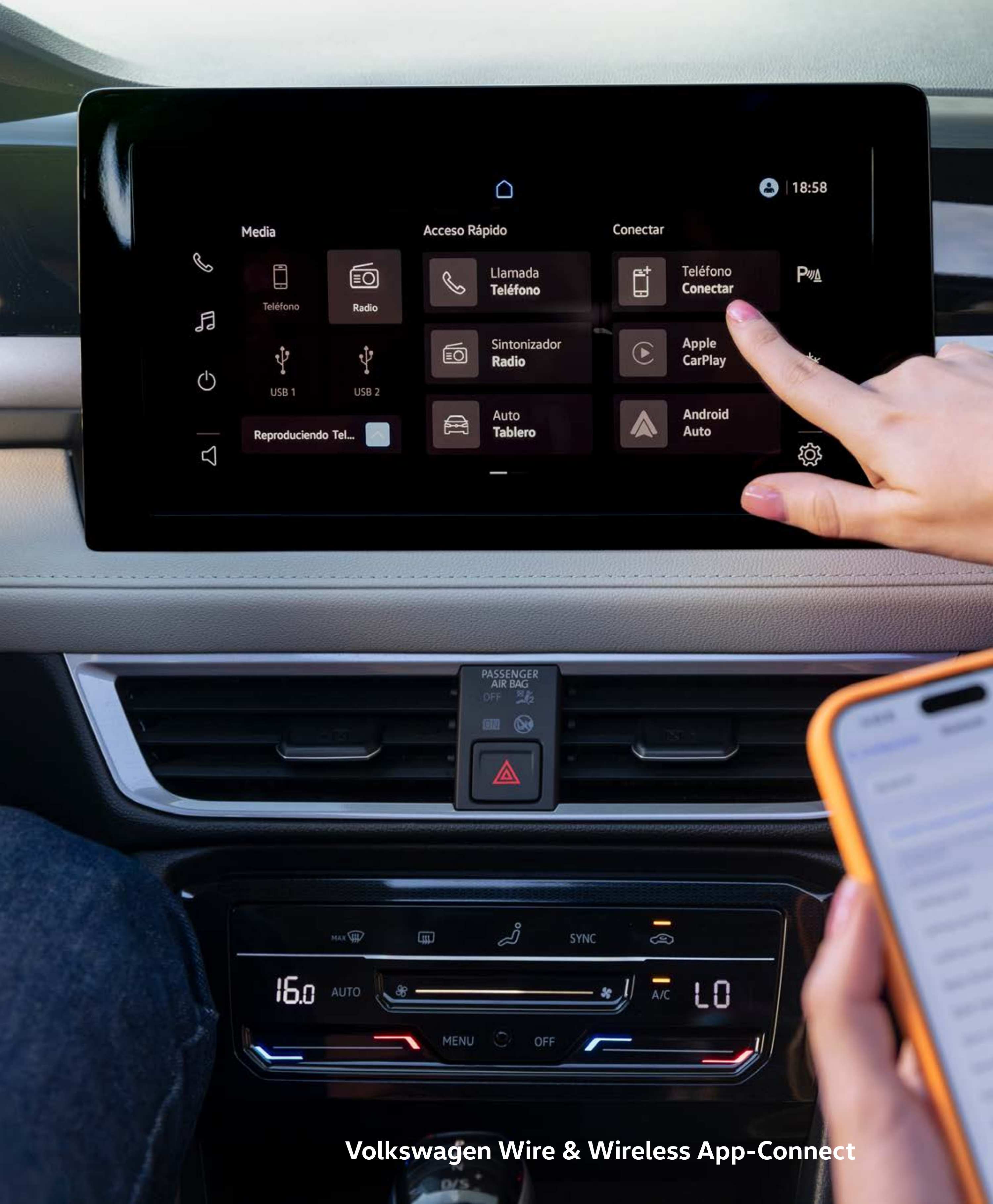
Volkswagen Wire & Wireless App-Connect