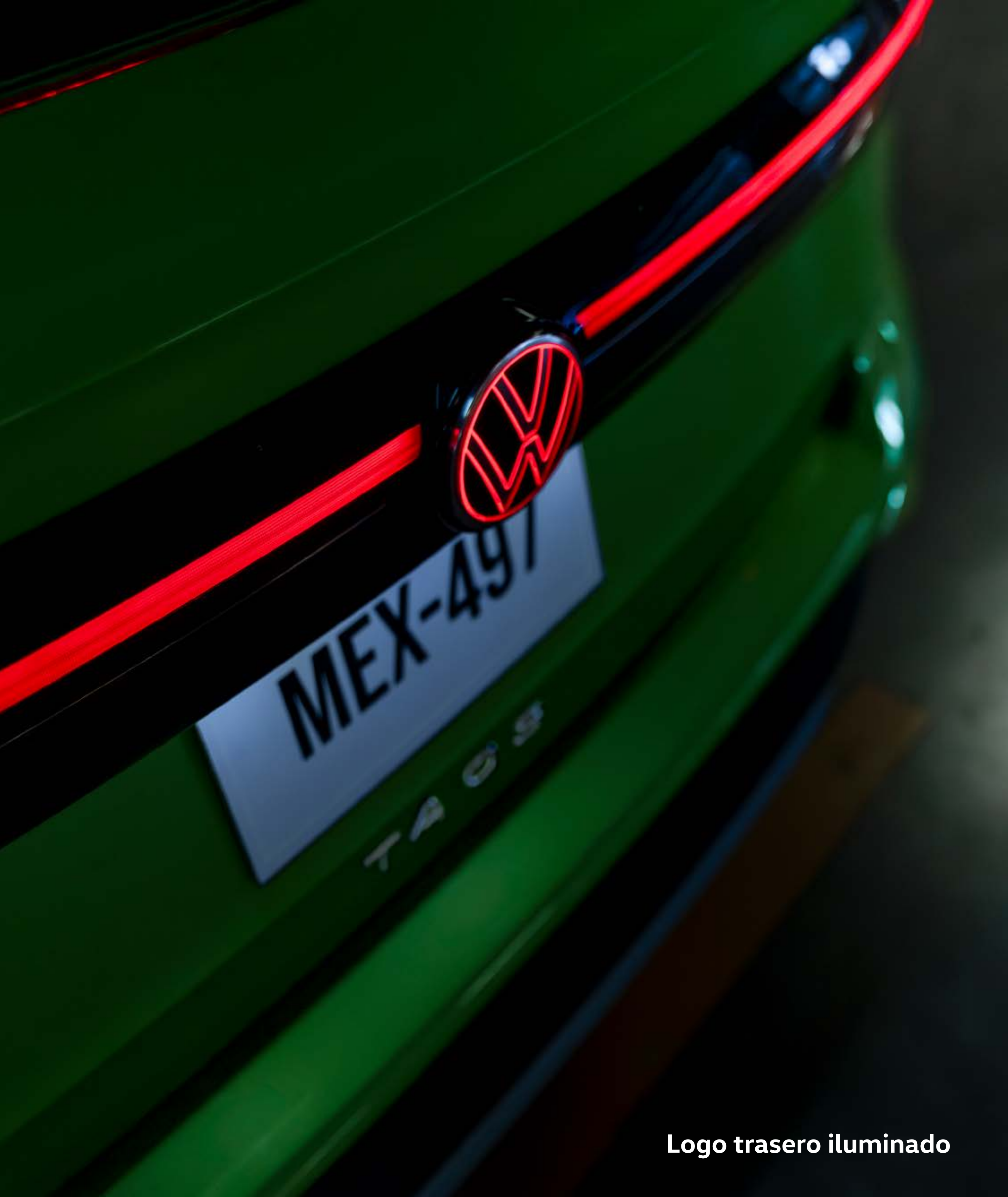
Logo trasero iluminado