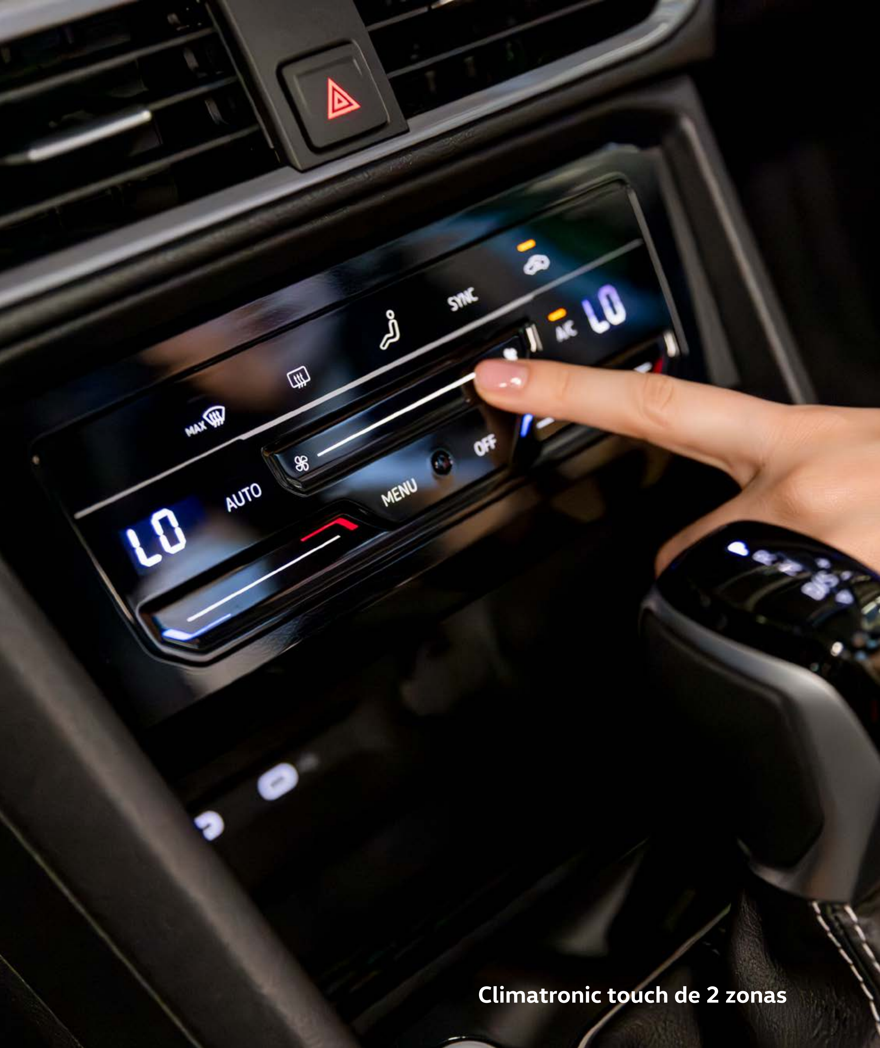
Climatronic touch de 2 zonas