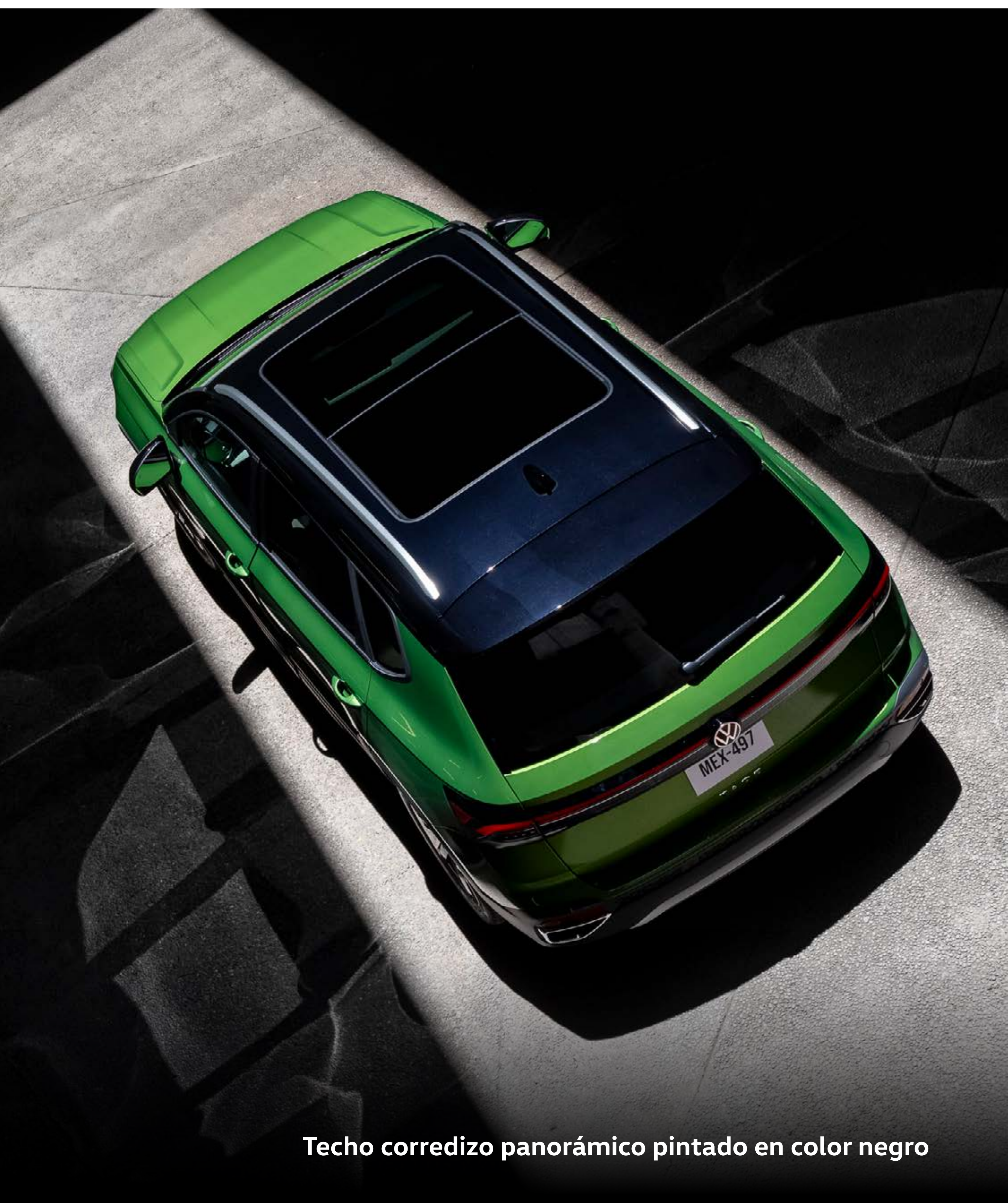
Techo corredizo panorámico pintado en color negro

Domingo de pícnic, sábado de paseo, viernes de compras, cualquier día es perfecto para sumarle un plus de placer al viaje y abrir el techo para dejarse llevar. HL