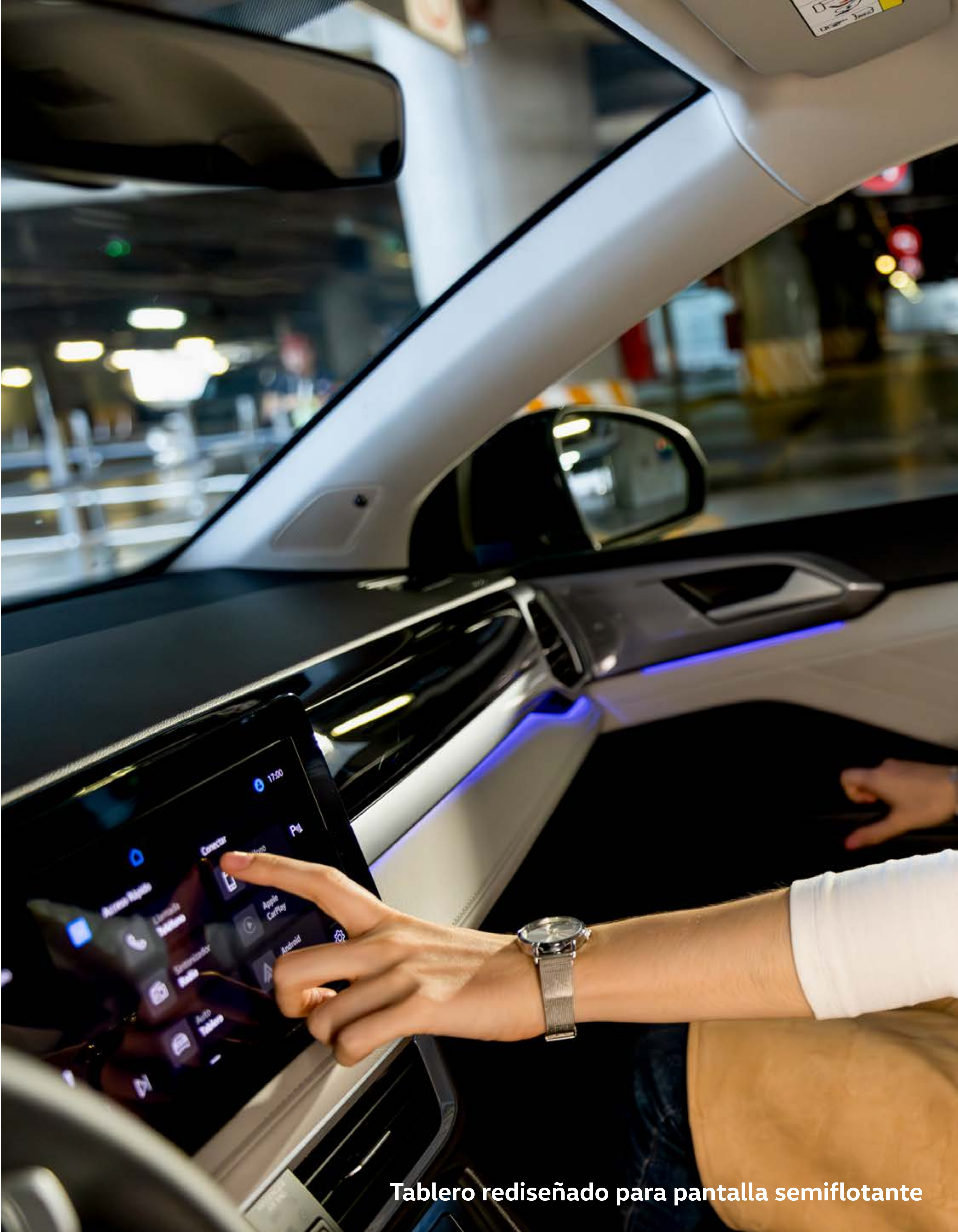
Tablero rediseñado para pantalla semiflotante