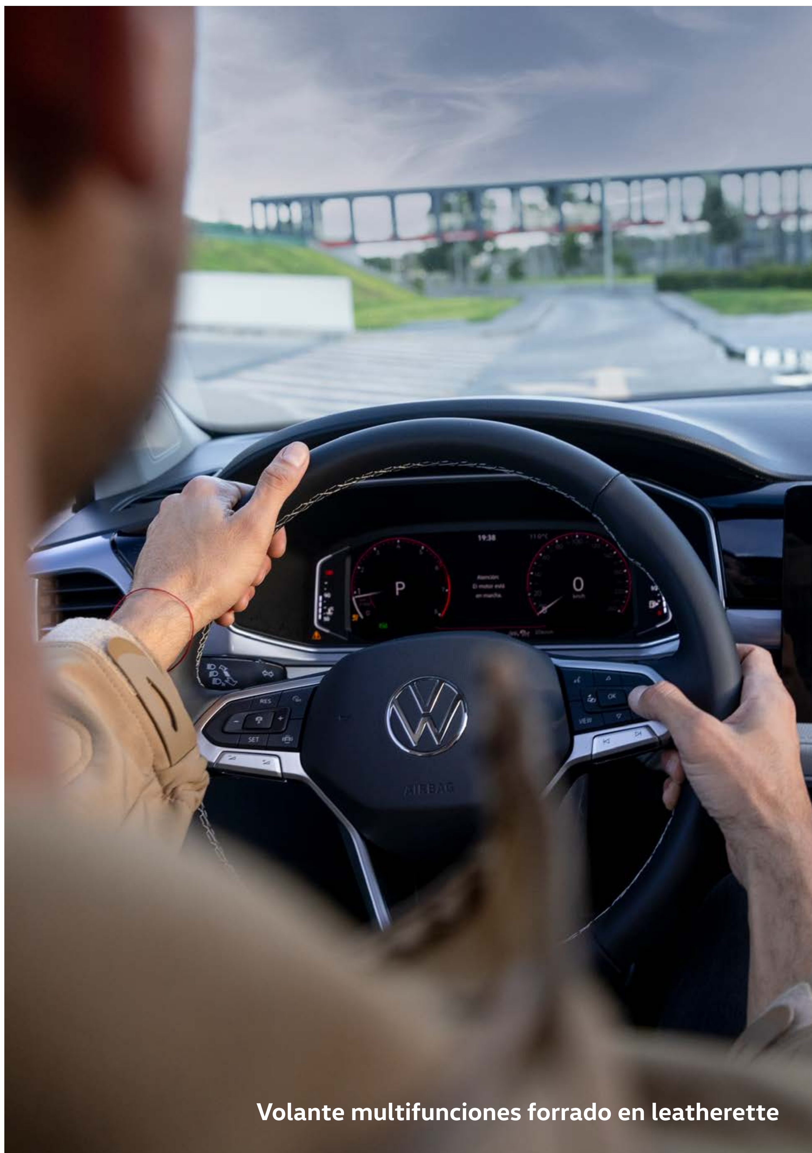
Volante multifunciones forrado en leatherette

Todos los comandos ahora los tienes en tu volante. La experiencia de manejo en Nuevo Taos es mejor que nunca, igual que la sensación suave de tocar la superficie de leatherette. CL HL