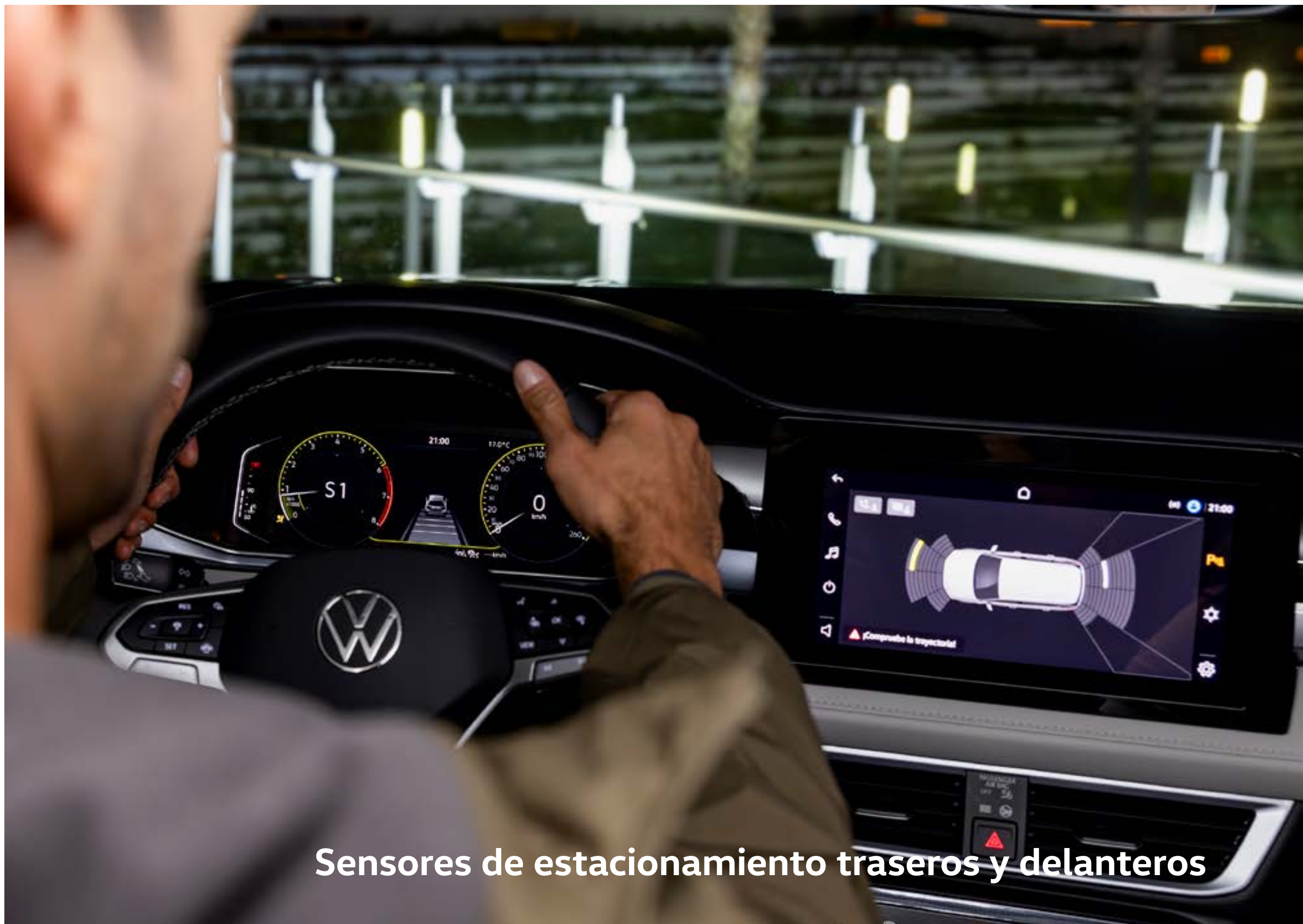
Sensores de estacionamiento traseros y delanteros

Con los sensores de estacionamiento delanteros y traseros van a poder medir cada maniobra con precisión milimétrica porque les avisará si hay vehículos, objetos o personas cada vez que salgan o entren en espacios de estacionamiento. HL