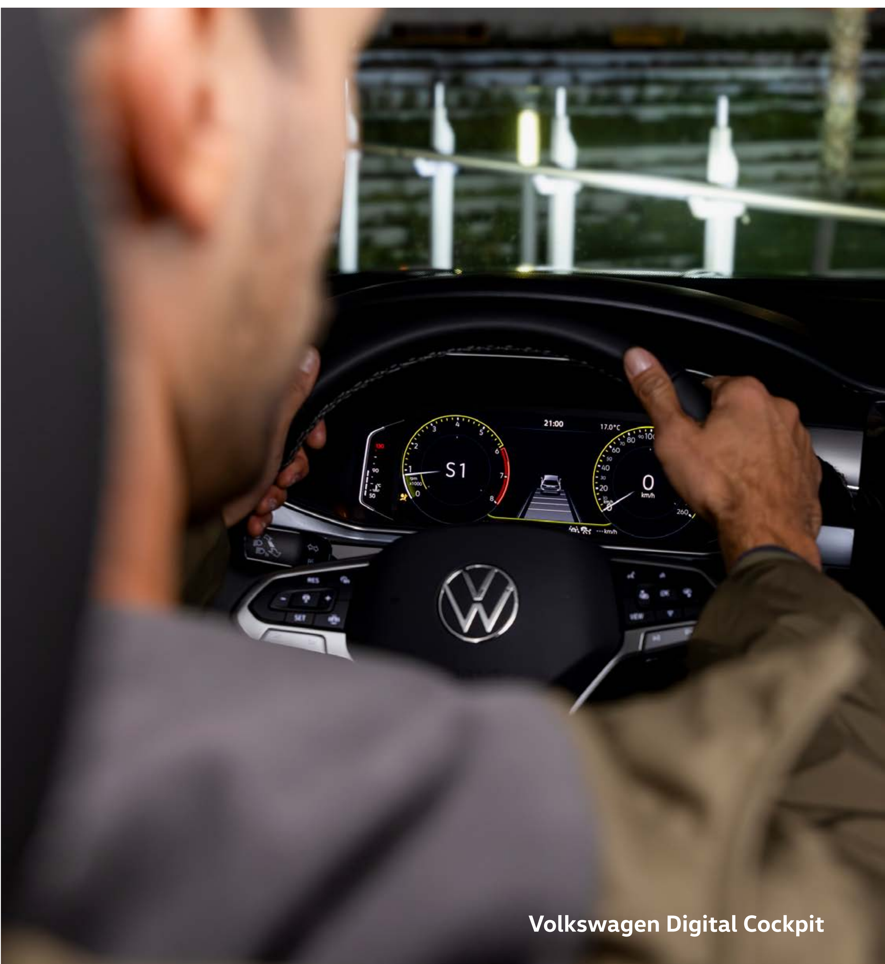
Volkswagen Digital Cockpit

Volkswagen Digital Cockpit es una experiencia visual increíble. Pueden elegir la información que quieren ver en su pantalla central para tener control completo de la experiencia de conducción. Todo bajo control (aunque también les gusta la improvisación y dejarse llevar un poco, ¿no?). HL