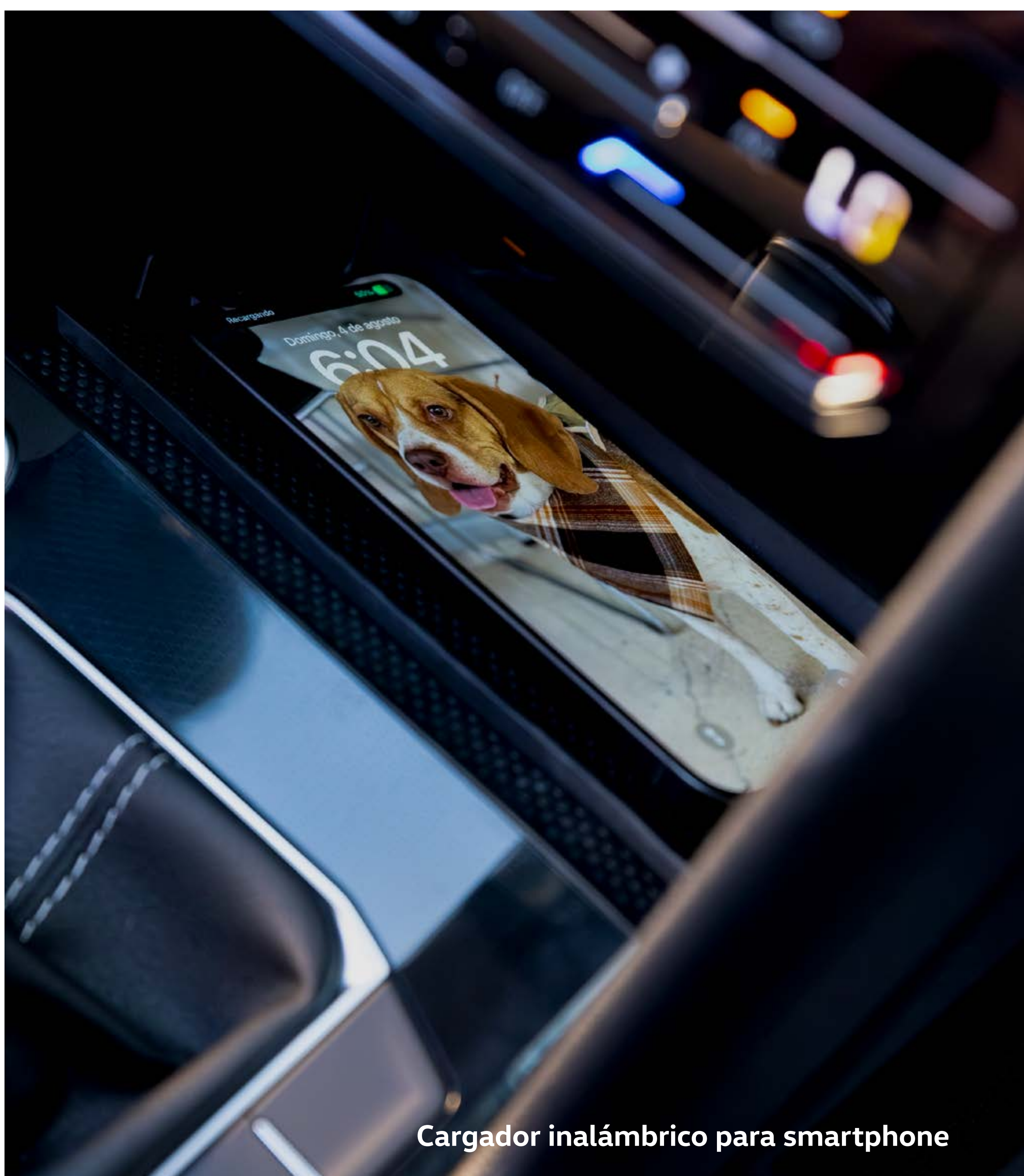
Cargador inalámbrico para smartphone

Carguen sus smartphones en Nuevo Taos sin cables. Es la mejor noticia para ustedes, aunque no tan buena para su amigo peludo de cuatro patas (todos sabemos que los cables son una de sus comidas favoritas). Así es, batería llena de forma rápida y eficiente para mantener una conectividad sin interrupciones durante tu viaje. ¡Guau! TL CL HL