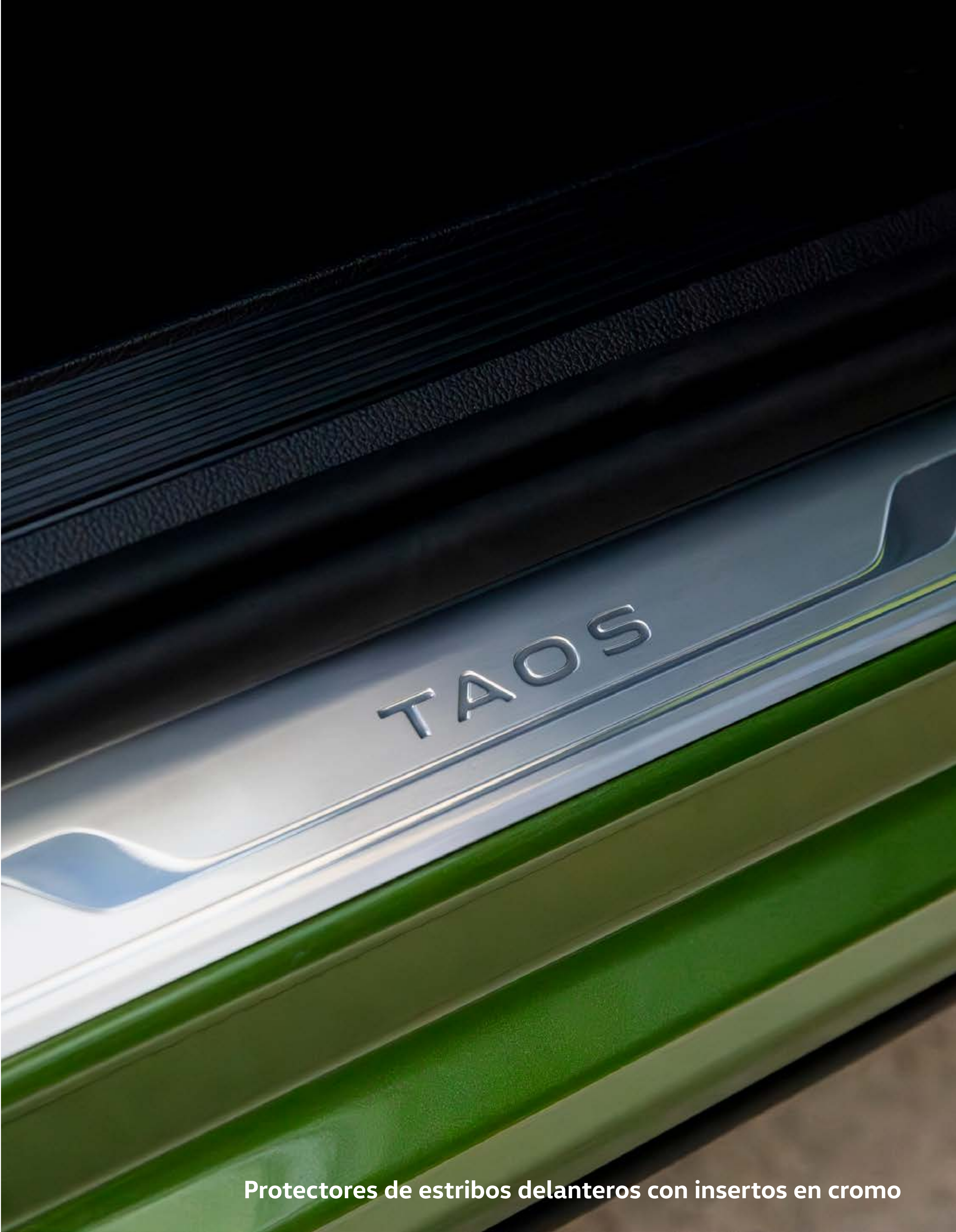
Protectores de estribos delanteros con insertos en cromo