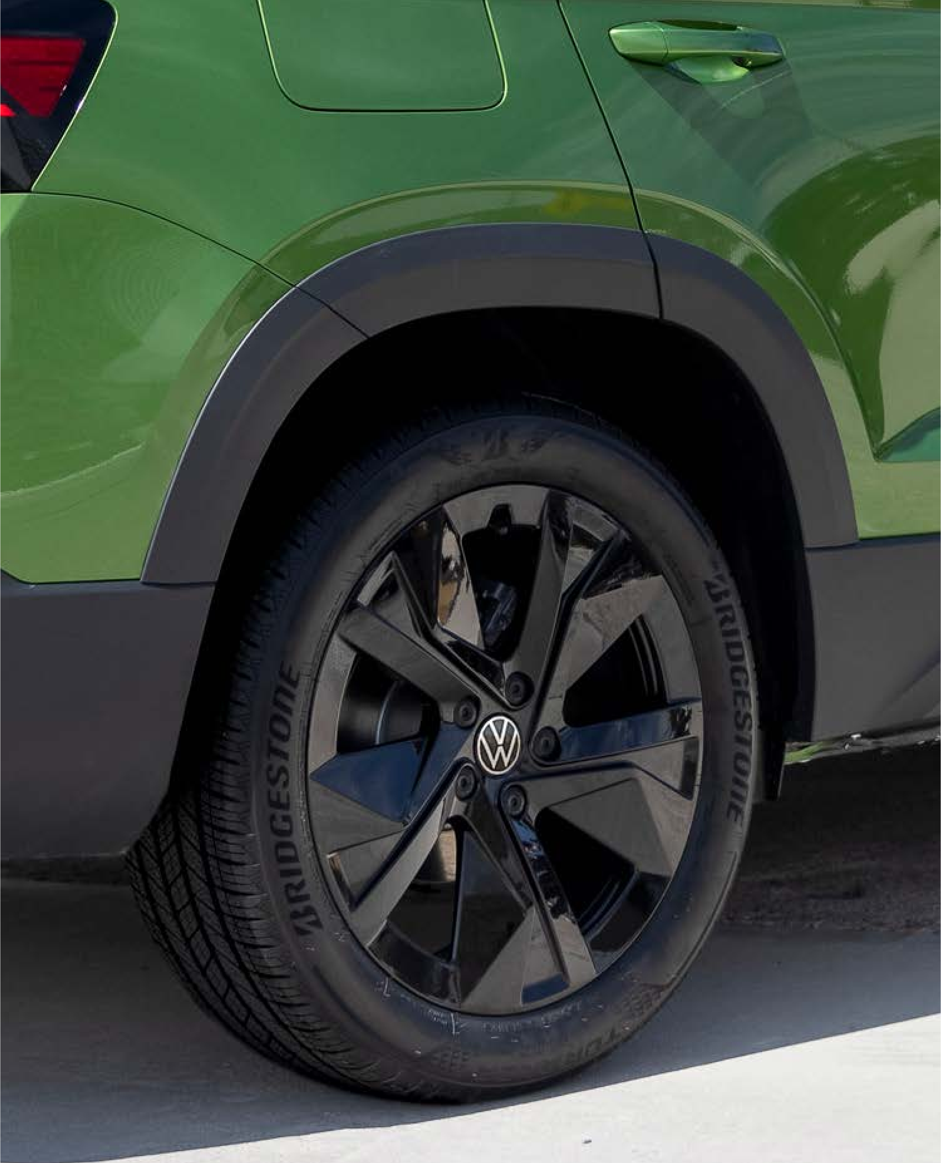
Rines de aluminio de 18" Grizzly Black