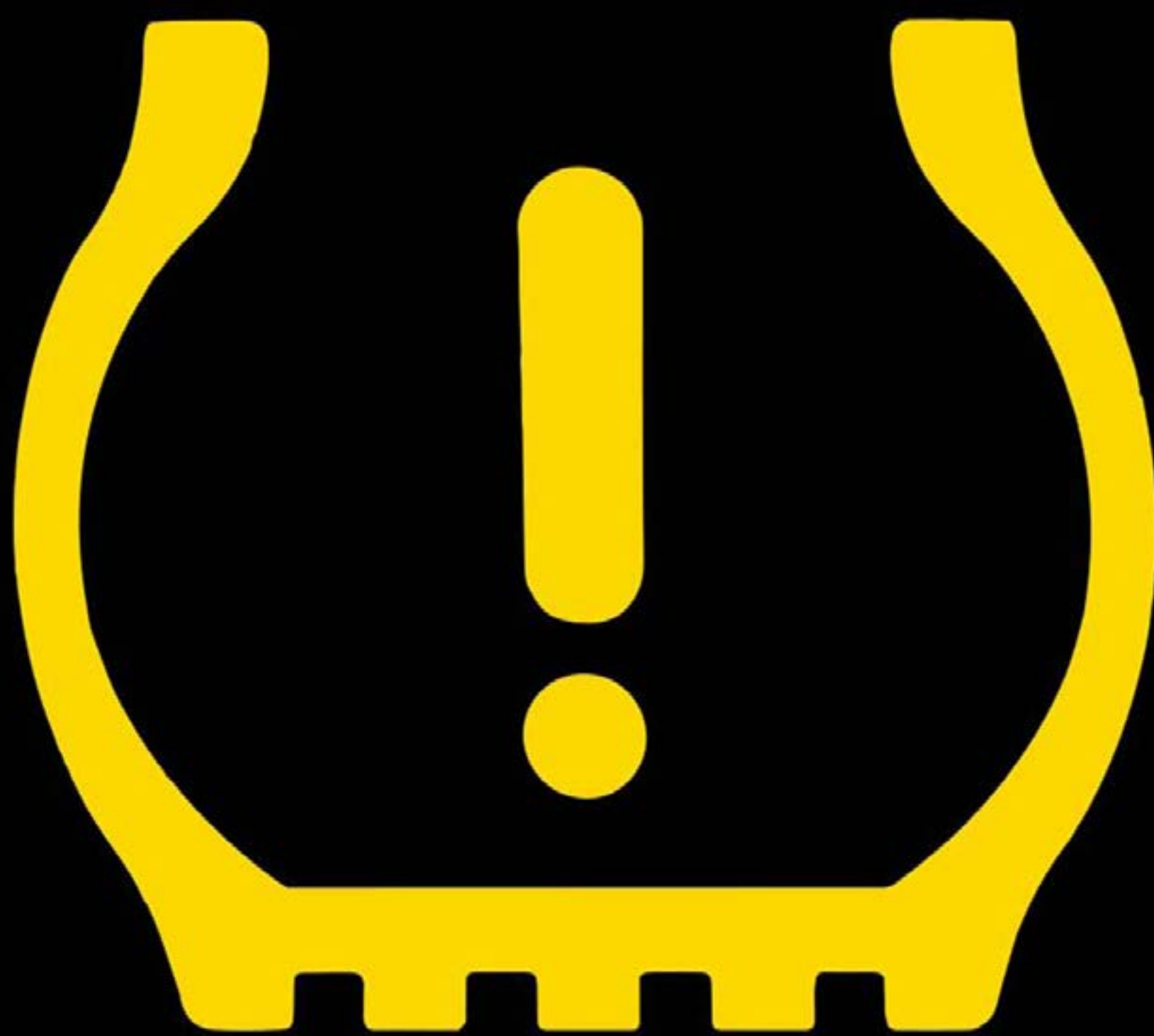
Testigo de pérdida de presión de neumáticos

Claro que no, si cada momento que viven juntos es paz en familia. ¿Presión? Eso se lo dejamos a este asistente que les avisará si la presión de alguna llanta bajó, así toman las precauciones necesarias en el momento. TL CL HL