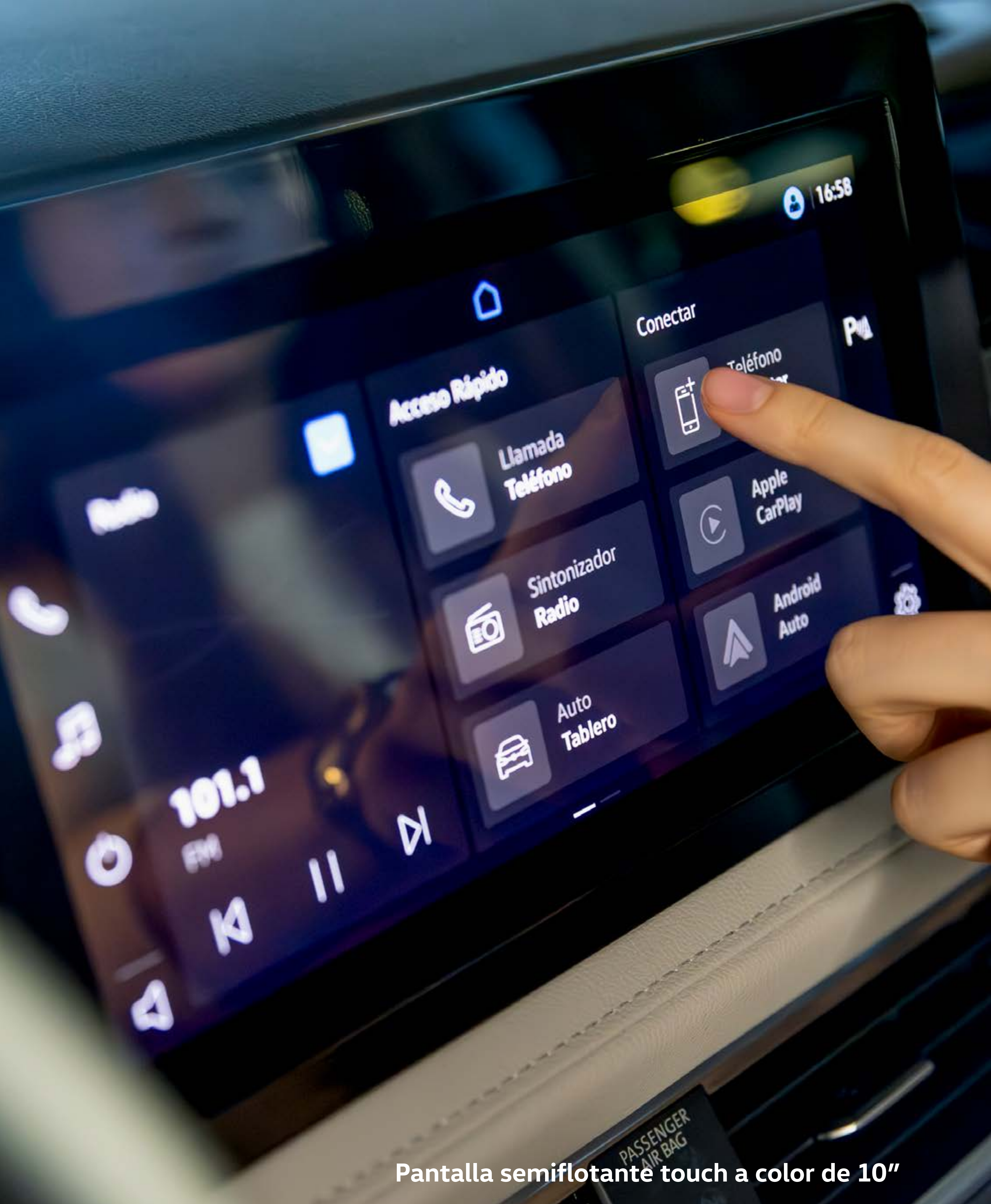
Pantalla semiflotante touch a color de 10"